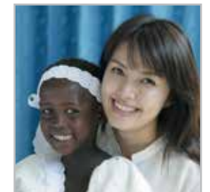
신애라 연기자, 한국컴패션 홍보대사