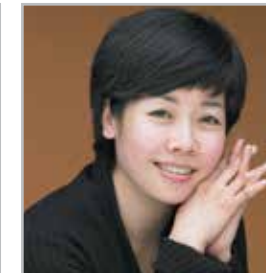
김미화 MC 개그우먼