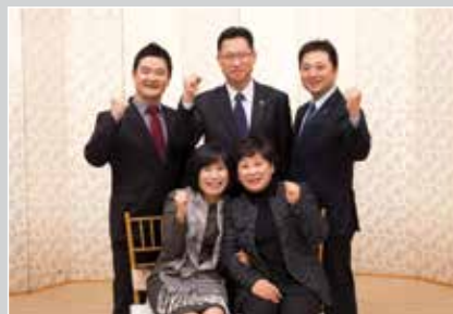
지역위원회 | 사업분과