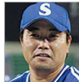
양준혁 프로야구 삼성구단의 전설, 해설위원